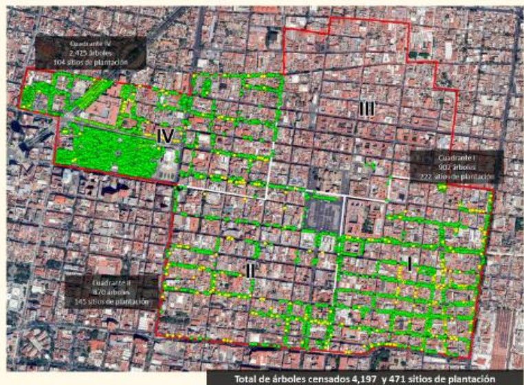
Avance del censo de arbolado Centro Histórico, con corte al 12 de febrero 2026