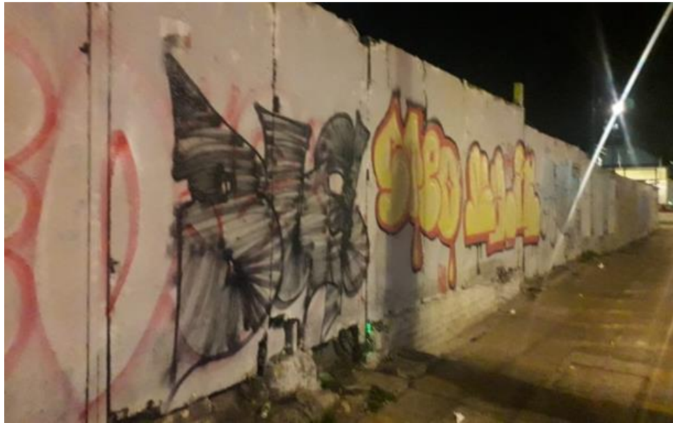
Eje Central y Av. Hidalgo