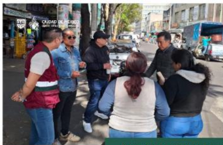
Recorrido interinstitucional para Retiro de CVP en Parque Roldan