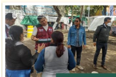
Recorrido interinstitucional para Retiro de CVP en Parque Roldan